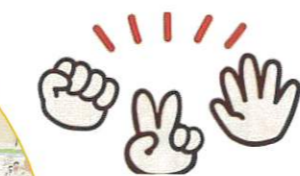
職員も一緒におやつ争奪 じゃんけん大会!