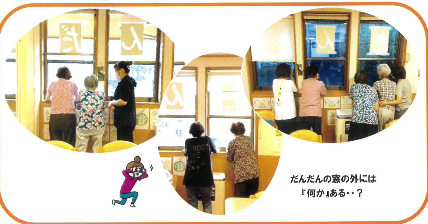
だんだんの窓の外には『何か』ある・・・？