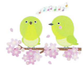
南公園の桜 咲き始めから、花吹雪まで堪能できました