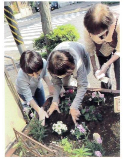
春のお花が終わり 夏の花に植え替え中

《 梅しごと 》 6月6日は『梅の日』らしいですね ちょうどその日に、梅シロップと 梅干仕込みました