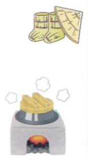
長屋門公園では、藁ぶき屋根の民家で懐かしい道具に触れました